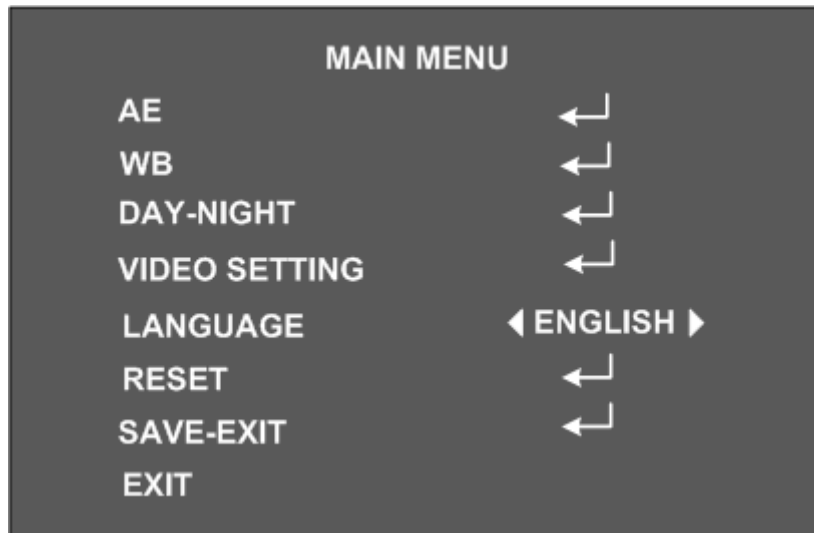
Рисунок 3 Окно главного меню настроек видеокамеры